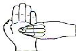
6.指尖在掌心中搓擦